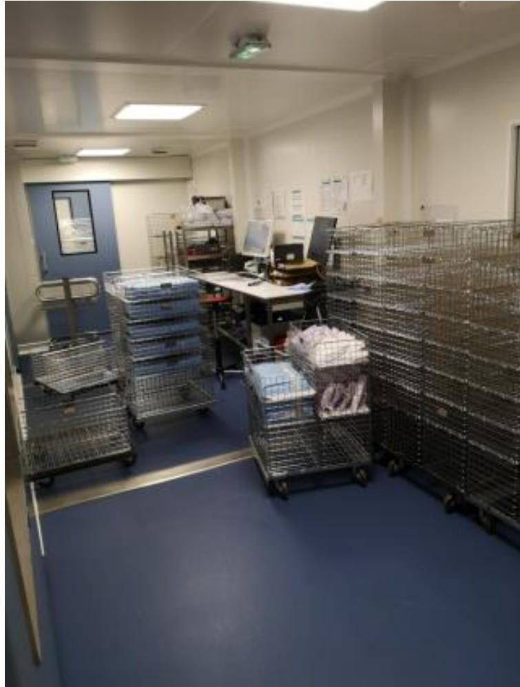
Zone de déchargement des autoclaves